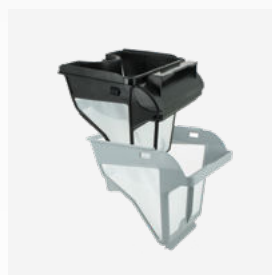
Bac filtrant Filtre double niveau : 150/60 µ