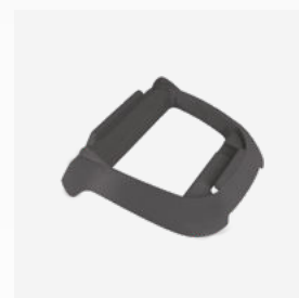
Socle pour boîtier de commande