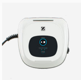
Boîtier de commande